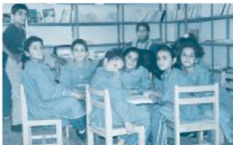
ホーシャ村の図書室にて

実際、ヨルダンの人は、疑い深いどころか、むしろ迂闊にも見えます。たとえば、初めて訪れた店で、釣銭を切らしていたりすると、たいていの