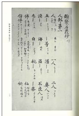
②『類聚名義抄：観智院本』（天理図書館善本叢書と書之部 第32巻）23p