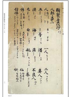
③『類聚名義抄：観智院本』（新天理図書館善本叢書 第9巻）23p

こうして見ると、生成AIなどのデジタル技術が浸透してきた近年ほどではないにしろ、人文科学の研究環境って、「(意外にも?) けっこう変わってきている」ように思えます。