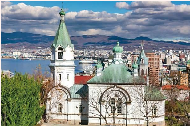
函館ハリストス正教会

領事館が開設されました。1861年（文久元年）にはロシア・ハリストス正教会のニコライが領事館付司祭として箱館に赴任し、1871年（明治4年）、11名の受洗があったと記されています。