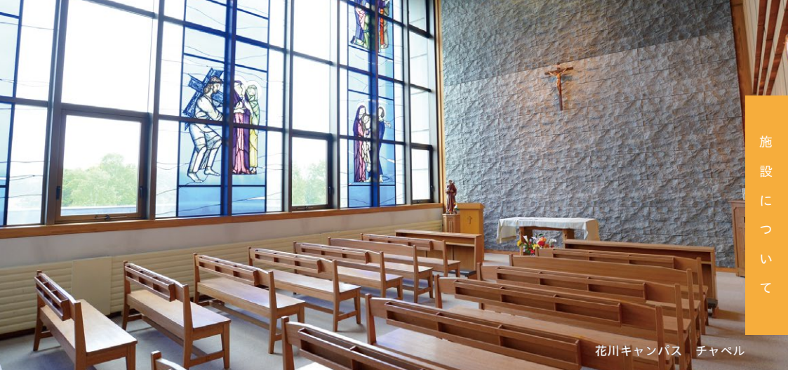
花川キャンパス チャペル