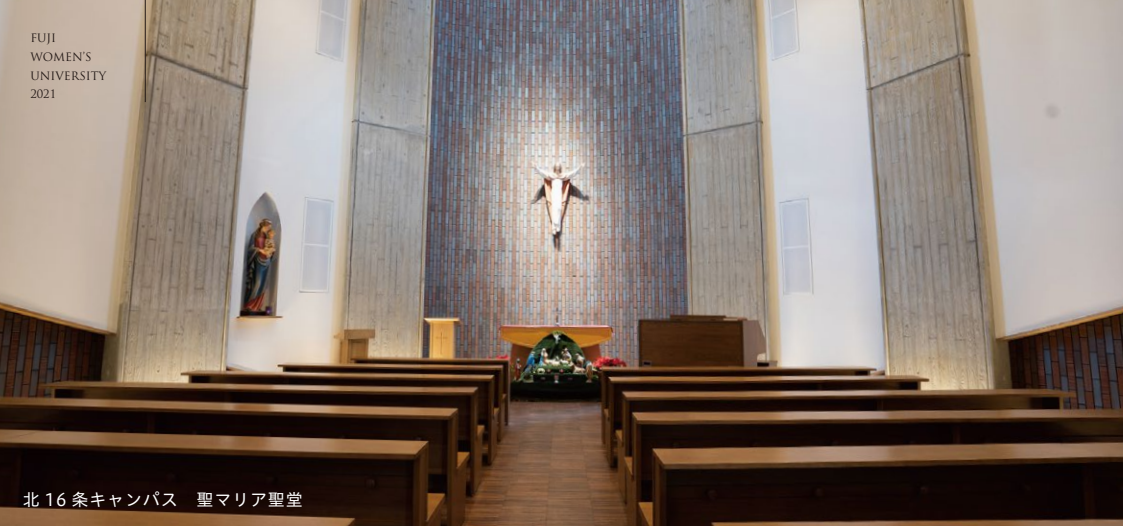
北16条キャンパス 聖マリア聖堂