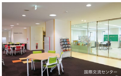
国際交流センター